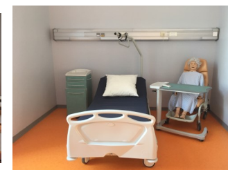
Salle de TP