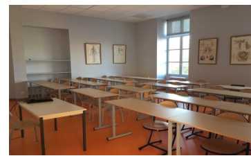
Salle de cours